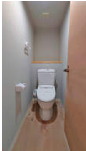
★トイレ 多機能便座