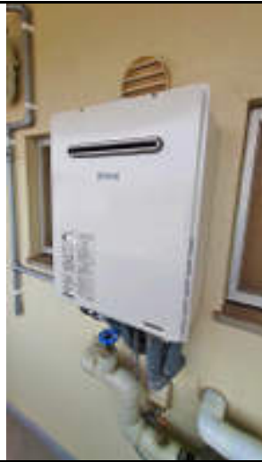
★給湯器も新品に交換済