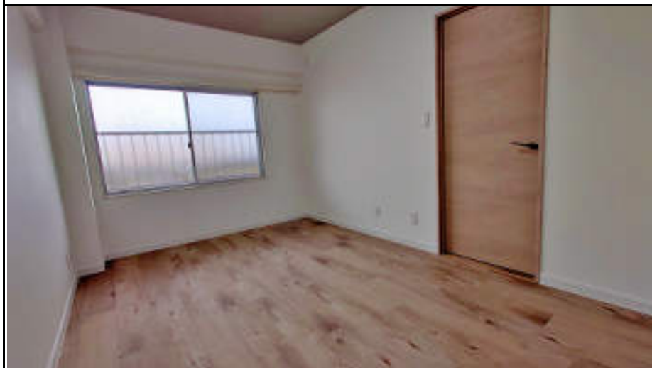
★北側洋室 床・壁紙・建具 全て新しくなっています