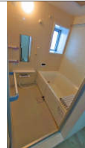
★使い勝手の良いシステムバス お掃除もらくちんです