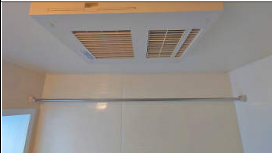
★浴室乾燥暖房機付で雨の日の洗濯も安心