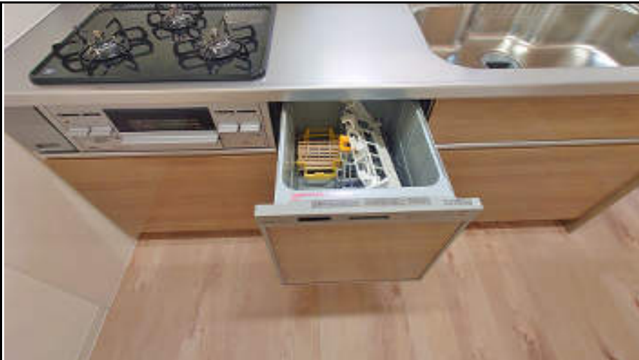
★食洗器完備で家事の負担を軽減できます