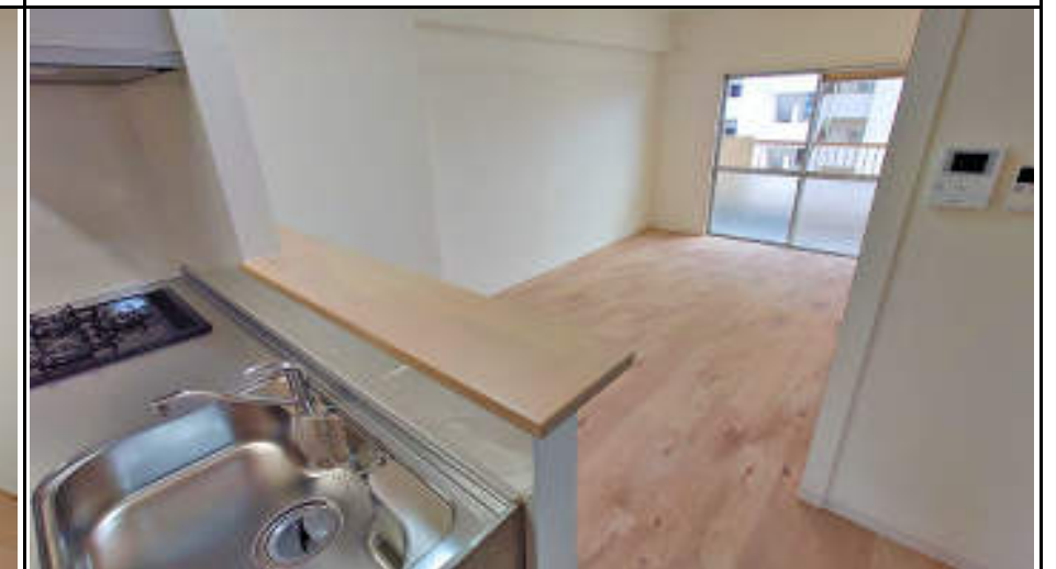
★リビングは陽当り・通風ともに良好です。