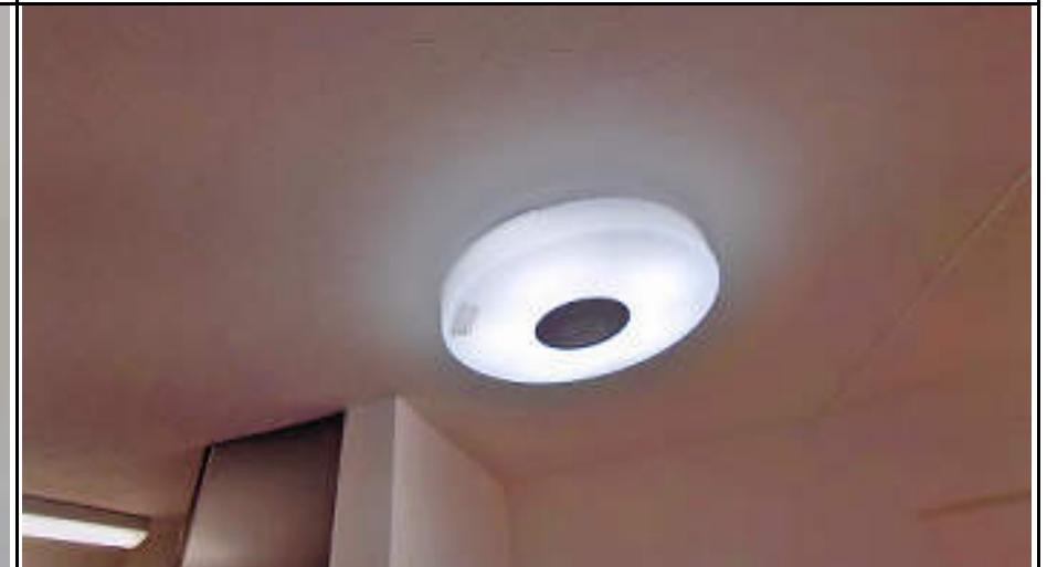
★Bluetoothスピーカー付照明