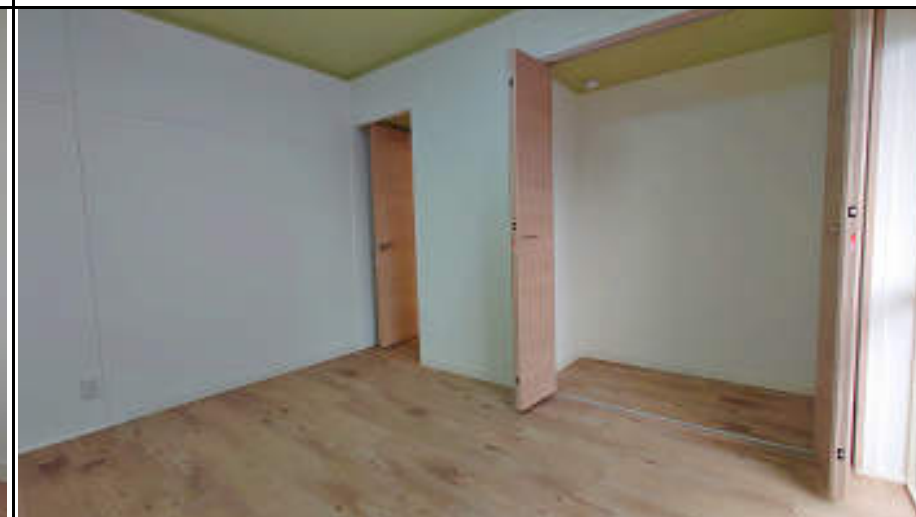
★南側洋室 陽当りもよく大型収納もあります