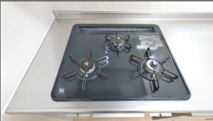
★センサー付き三口コンロ