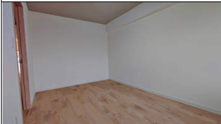
★サービスルーム 窓はありませんが、お部屋として十分利用できます