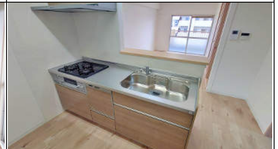
★対面カウンターキッチンなのでリビングとの会話を妨げません