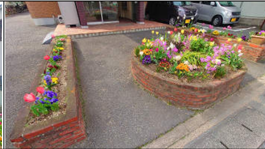
★エントランス前では花壇がお出迎え