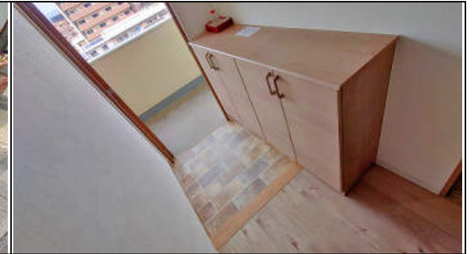
★玄関収納 木目調の落ち着いたデザインです