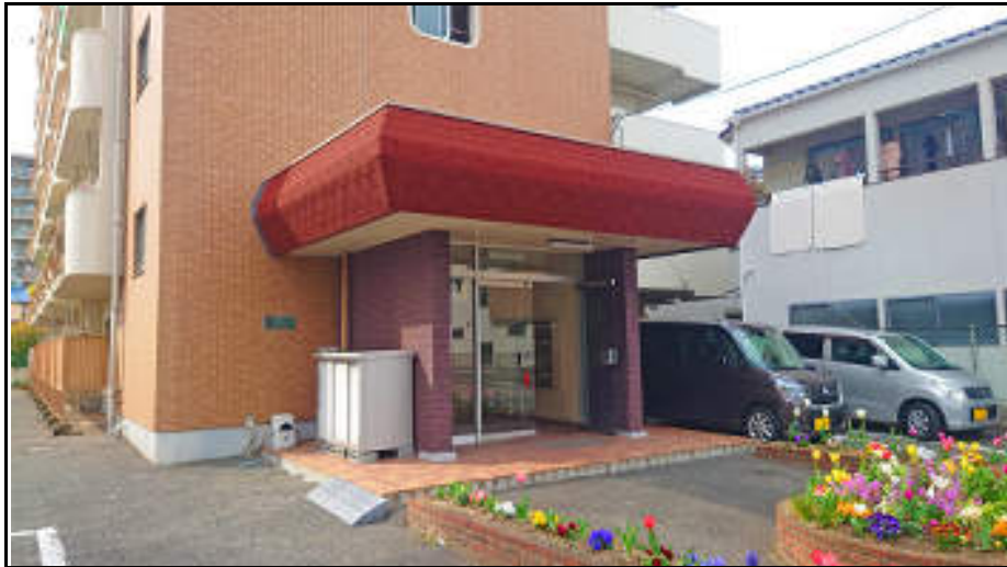
★清潔で手入れの行き届いた外観