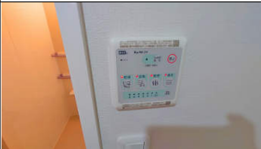
★浴室乾燥機はタイマーもセットできてらくちん