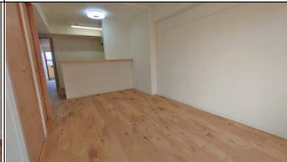
★LDK 13.8帖 ゆったり過ごせませ