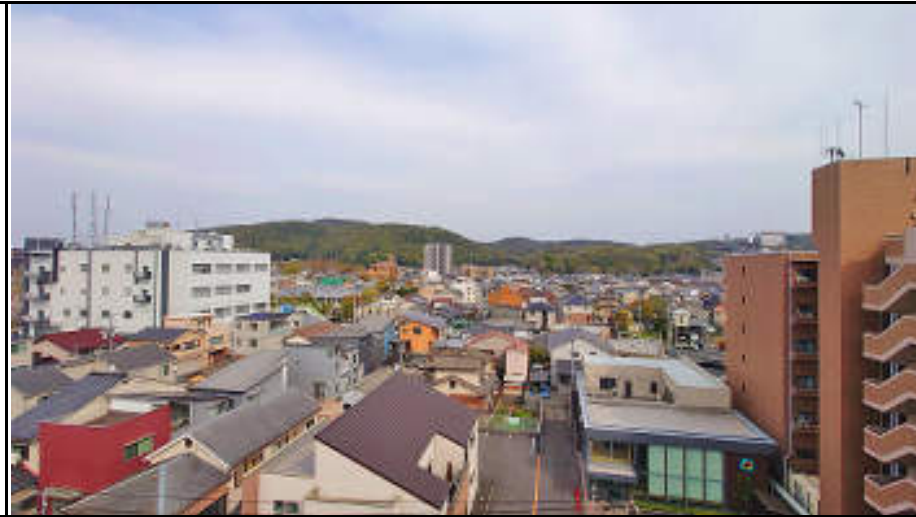
★バルコニーからの眺望