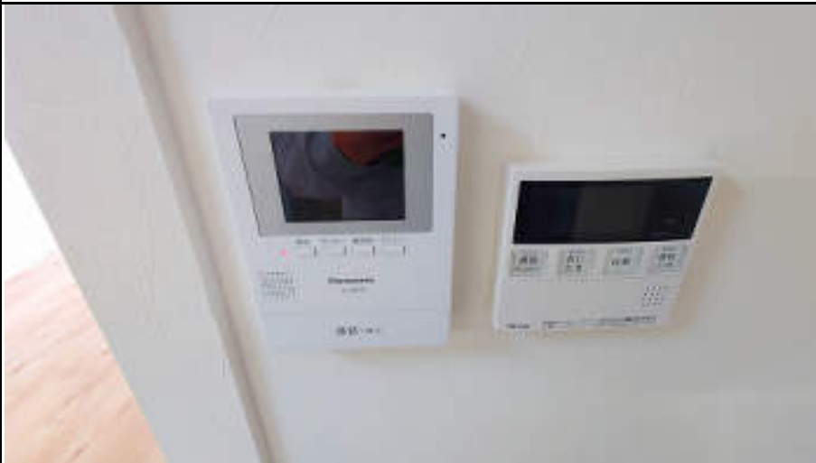
★TVモニター付インターホン&給湯リモコン(追い焚き付)