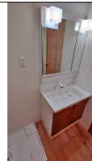
★シャワー水栓付洗面化粧台 三面鏡の裏は収納です